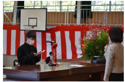
誓いの言葉 (代表TKくん)